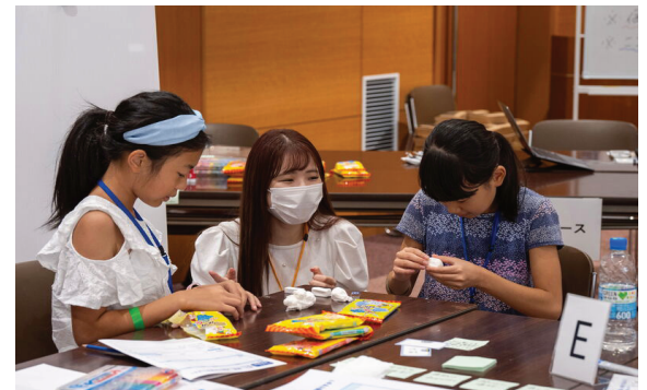
大学生と一緒にチームで課題に取り組みます